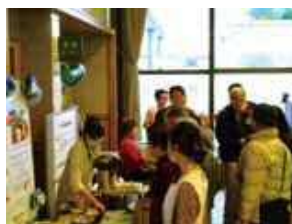
イベント当日の様子