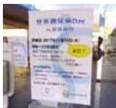
イベント案内ポスター

最後に、糖尿病に限らず、知識も経験も豊富な医療スタッフが揃う病院だからこそ、正しい情報発信の場を設けることが必要だと感じています。イベントは毎年開催する予定です。是非ご興味のある方へお声かけください。