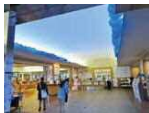
正面入り口のブルーライトアップ