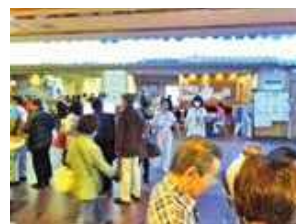
イベント当日の様子