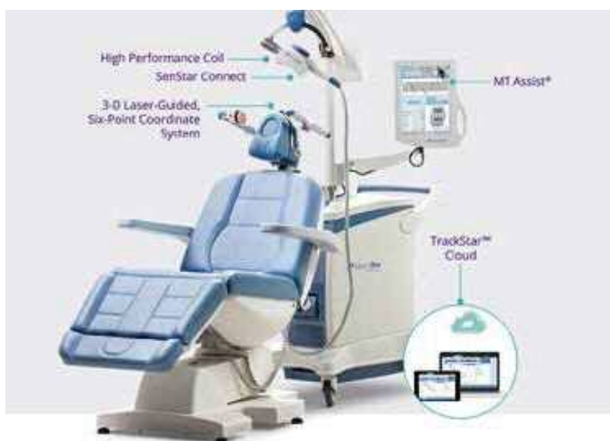
rTMS (反復性経頭蓋磁気刺激)参考画像