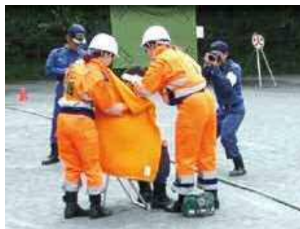
女子隊 (被災者救護の様子)

この結果に気を緩ませることなく、今後も院内の消防・防災体制ならび職員の意識を維持向上させ、地域の皆様に、より安心してご利用頂ける病院を目指してまいります。