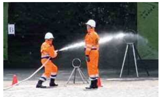
男子隊 (二号消火栓放水の様子)

是非当院に患者さんをご紹介ください。ご紹介の際は患者さんに「 診療情報提供書(紹介状) 」をお渡しの上、当院にご持参いただくようお願いください。 ※2回目以降のご受診でも、必要時には紹介状をお渡しいただくようお願いいたします。