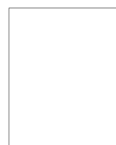
あまの たかし 天野 貴司