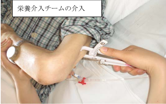
栄養介入チームの介入